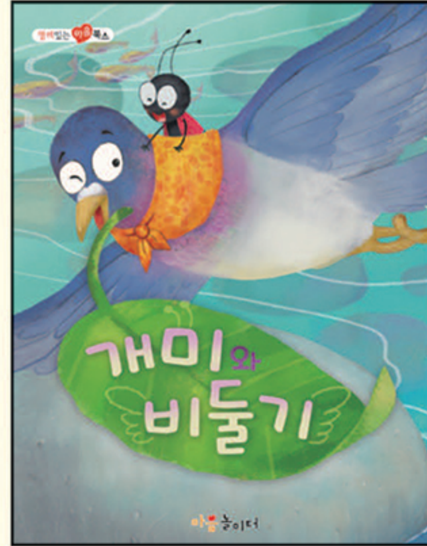
2. 개미와 비둘기