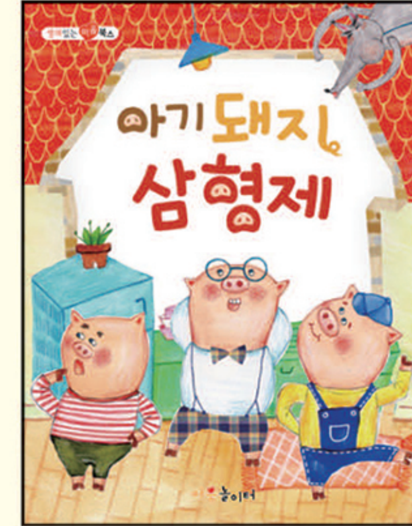
5. 아기돼지 삼형제