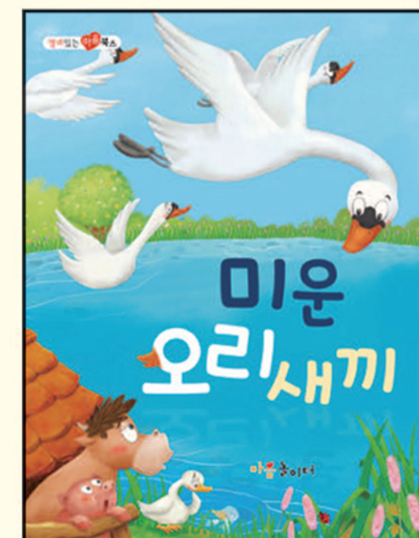
10. 미운 오리 새끼