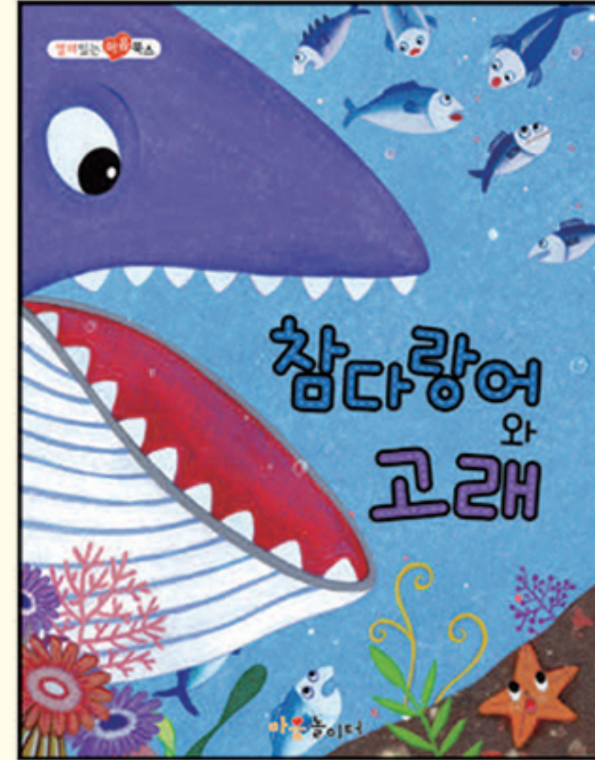
3. 참다랑어와 고래