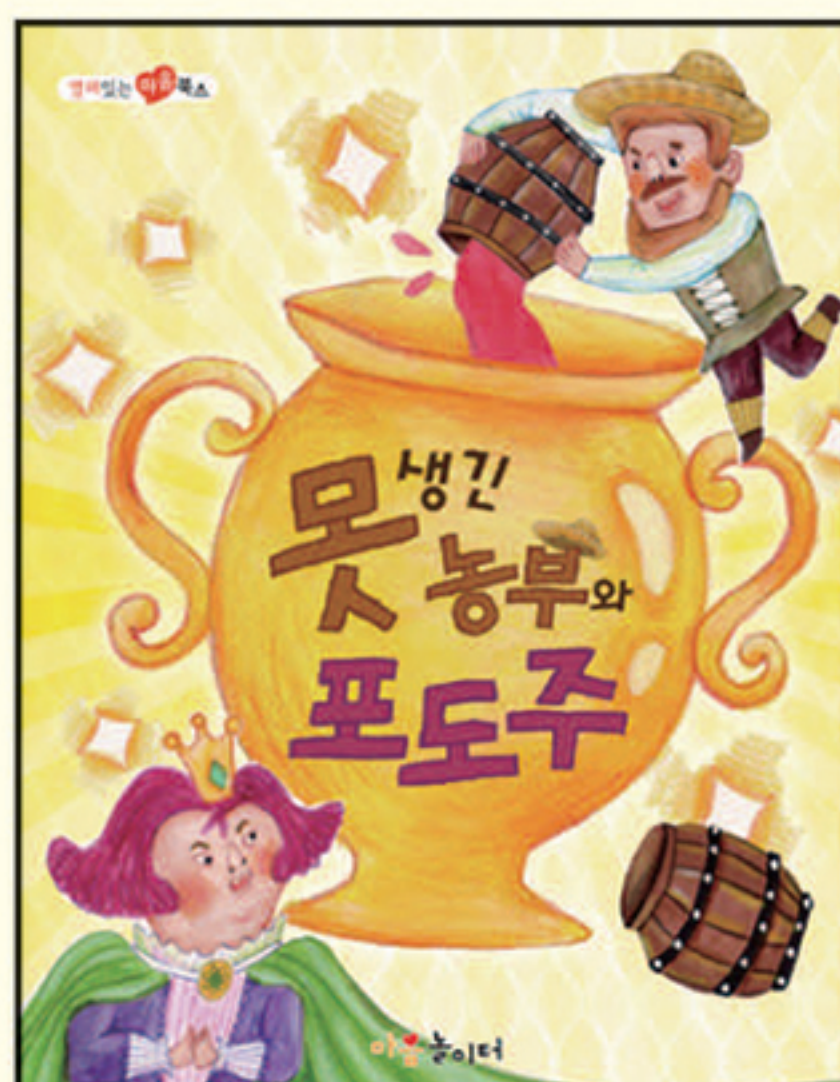
11. 못생긴 농부와 포도주