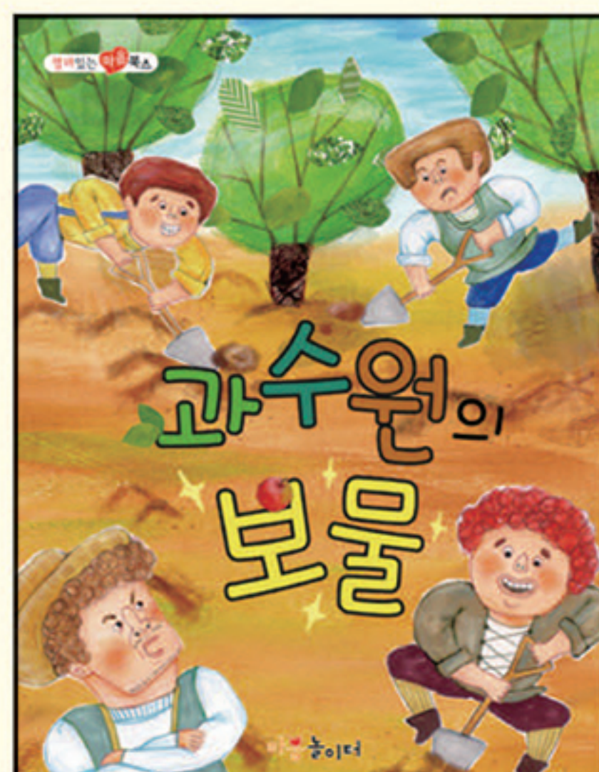
12. 과수원의 보물