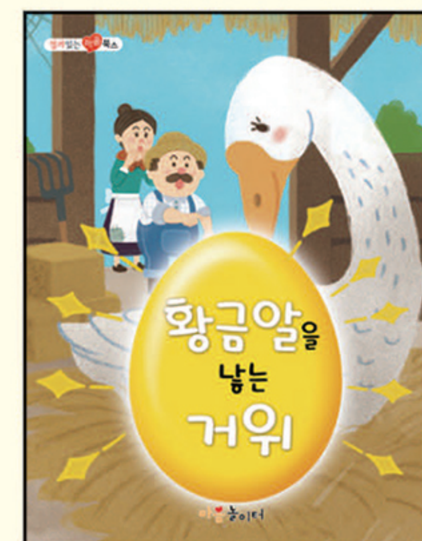
20. 황금알을 낳는 거위