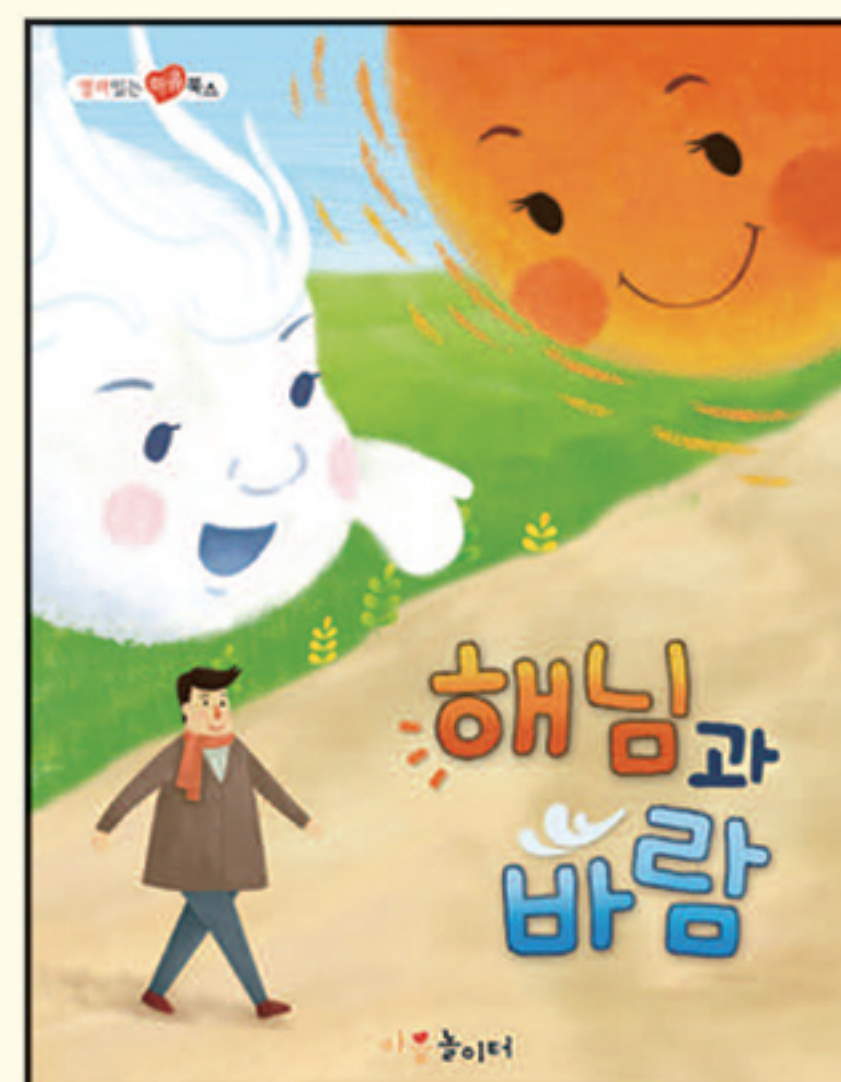
8. 해님과 바람