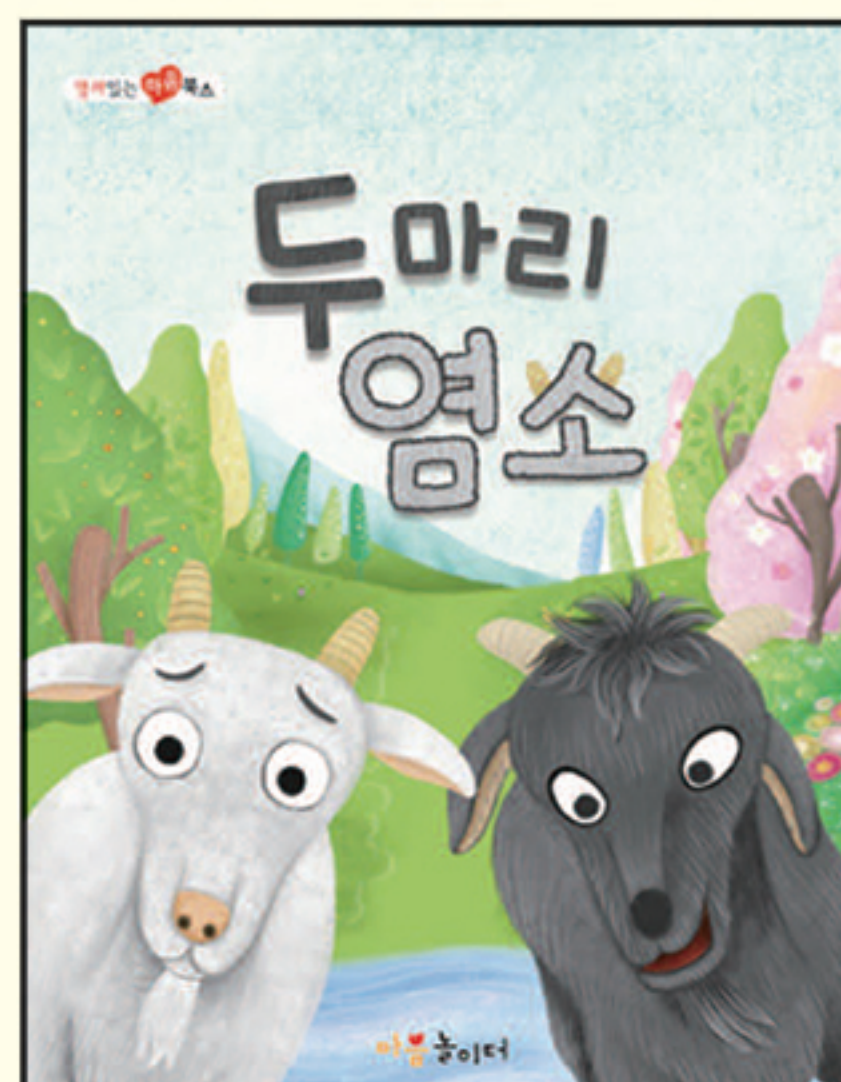
13. 두마리 염소