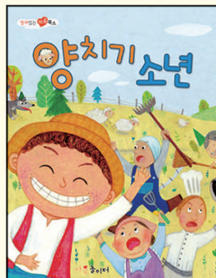
14. 양치기 소년