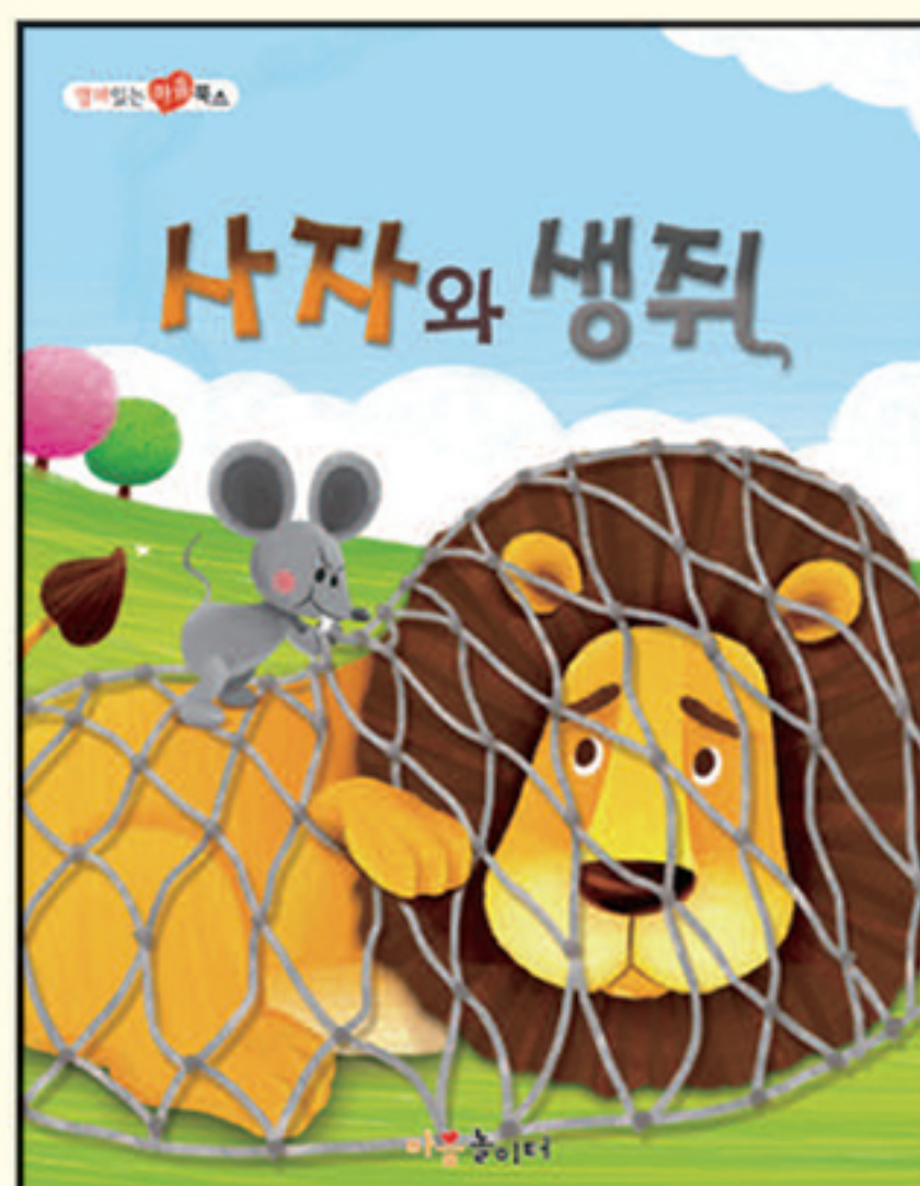
6. 사자와 생쥐