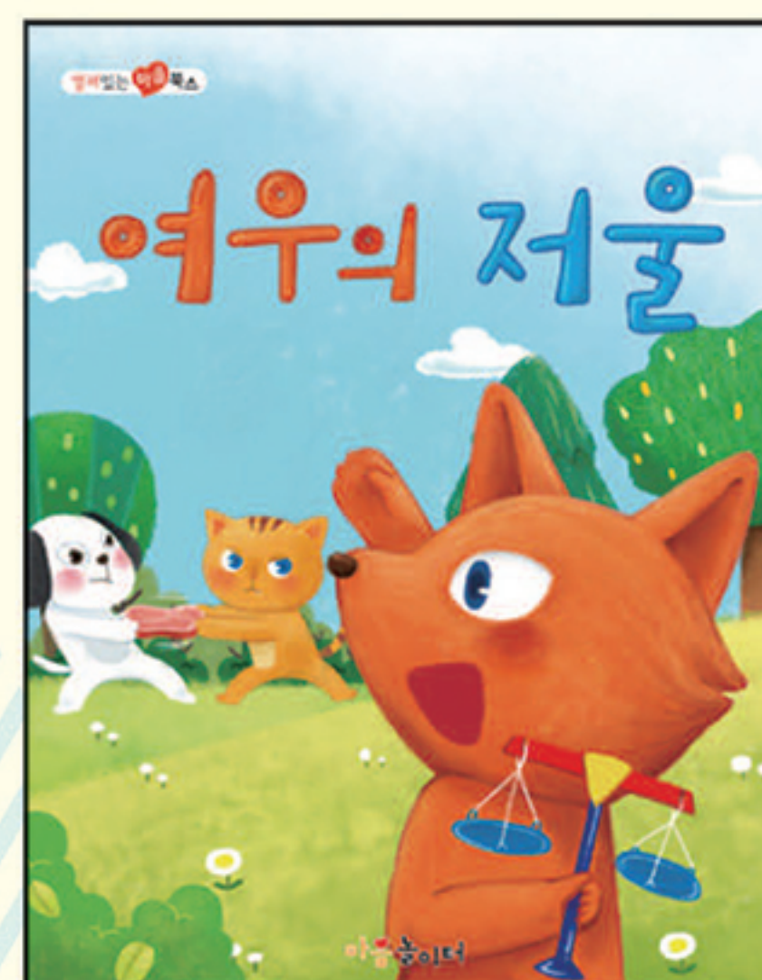
18. 여우의 저울