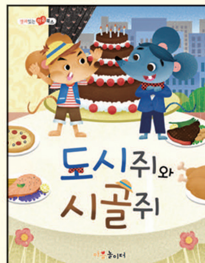
15. 도시쥐와 시골쥐