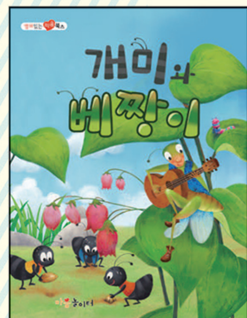
17. 개미와 베짚이