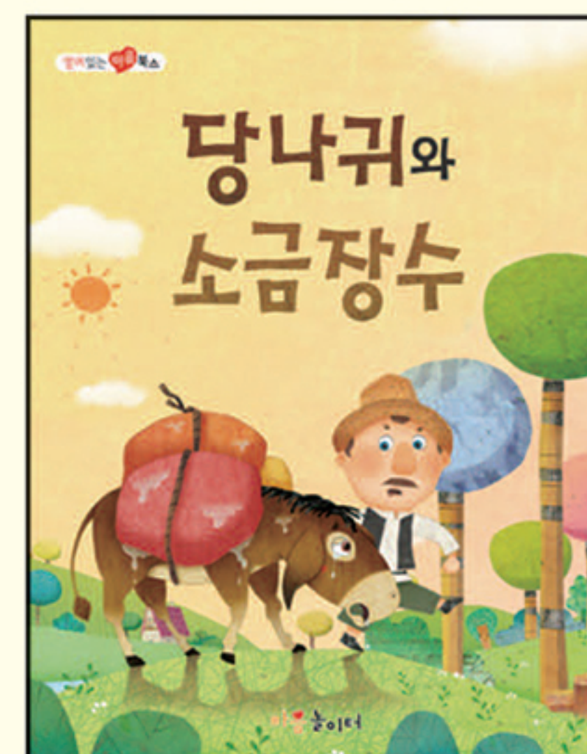
19. 당나귀와 소금장수