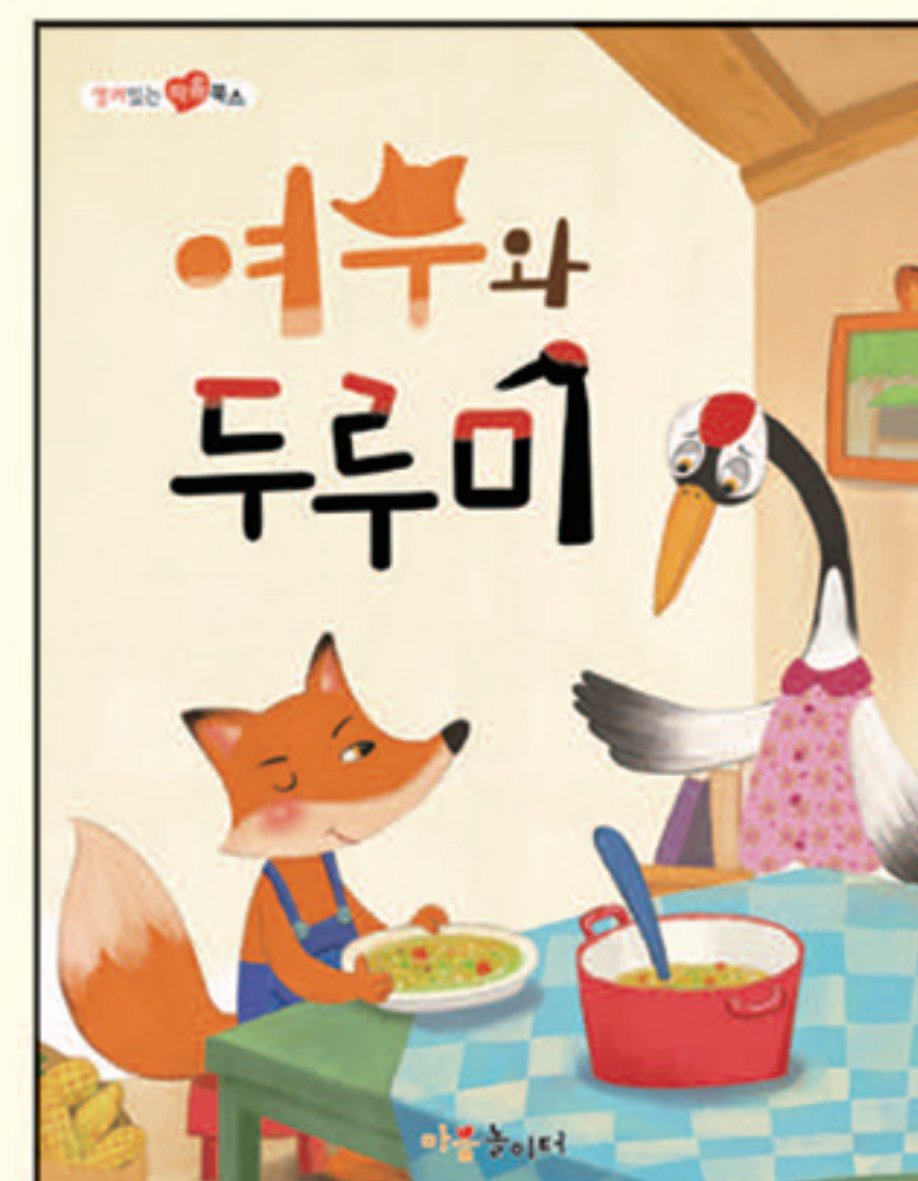
9. 여우와 두루미