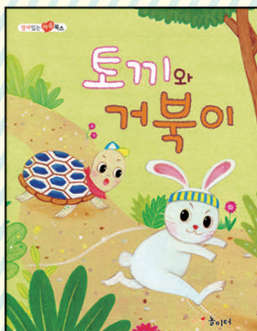
16. 토끼와 거북이