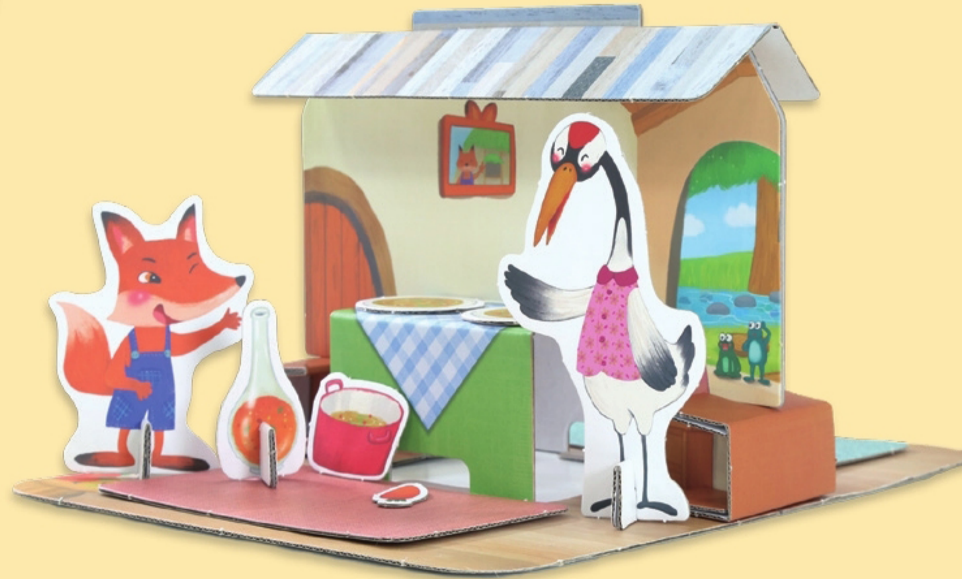
마음극장 Play set