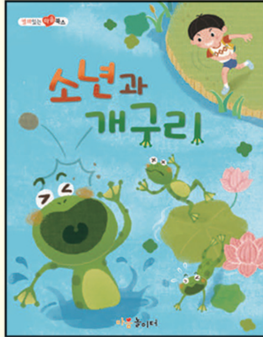
1. 소년과 개구리

마음놀이터 카페(cafe.naver.com/kaggum)에서 마음놀이터 활용법과 많은 정보를 공유하실 수 있습니다.