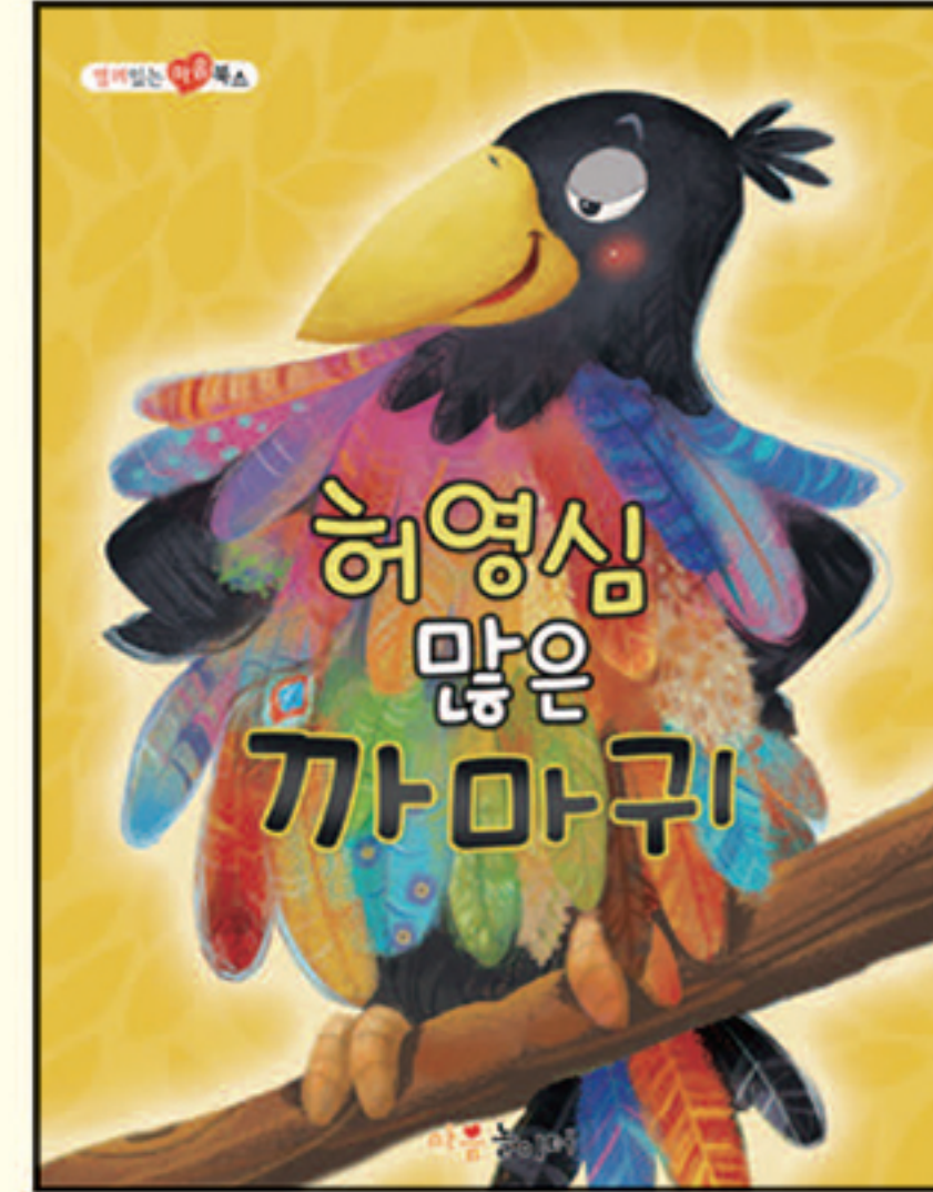
4. 허영심 많은 까마귀